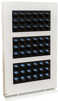
Länge 113 Höhe 180