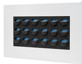
Länge 112/Höhe 72

erhältlich in Rahmenfarben weiß, silber und anthrazit